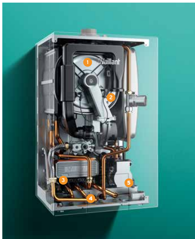
ecoTEC plus extraCONDENS, vue intérieure aux rayons X.