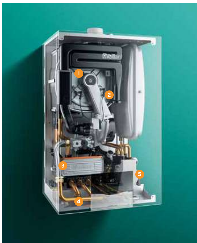
ecoTEC plus, vue intérieure aux rayons X.

réouverture du robinet pour se rincer. Vous profitez ainsi d'un logement où il fait bon vivre, avec une température agréable et de l'eau chaude disponible rapidement dès que vous en avez besoin.