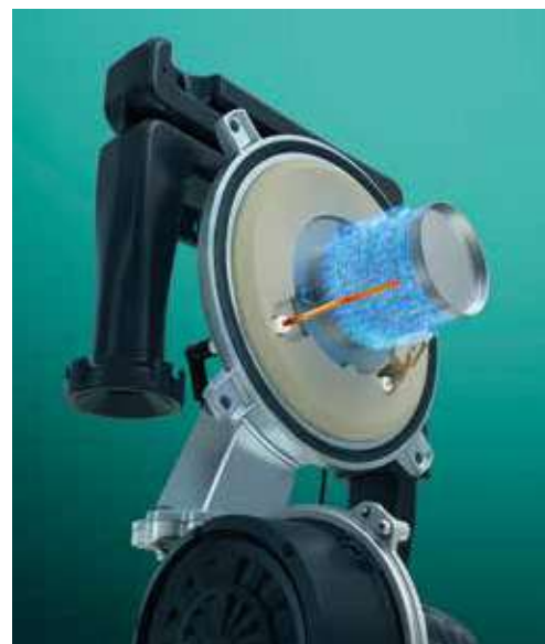
Technologie ioniDETECT : une combustion optimale